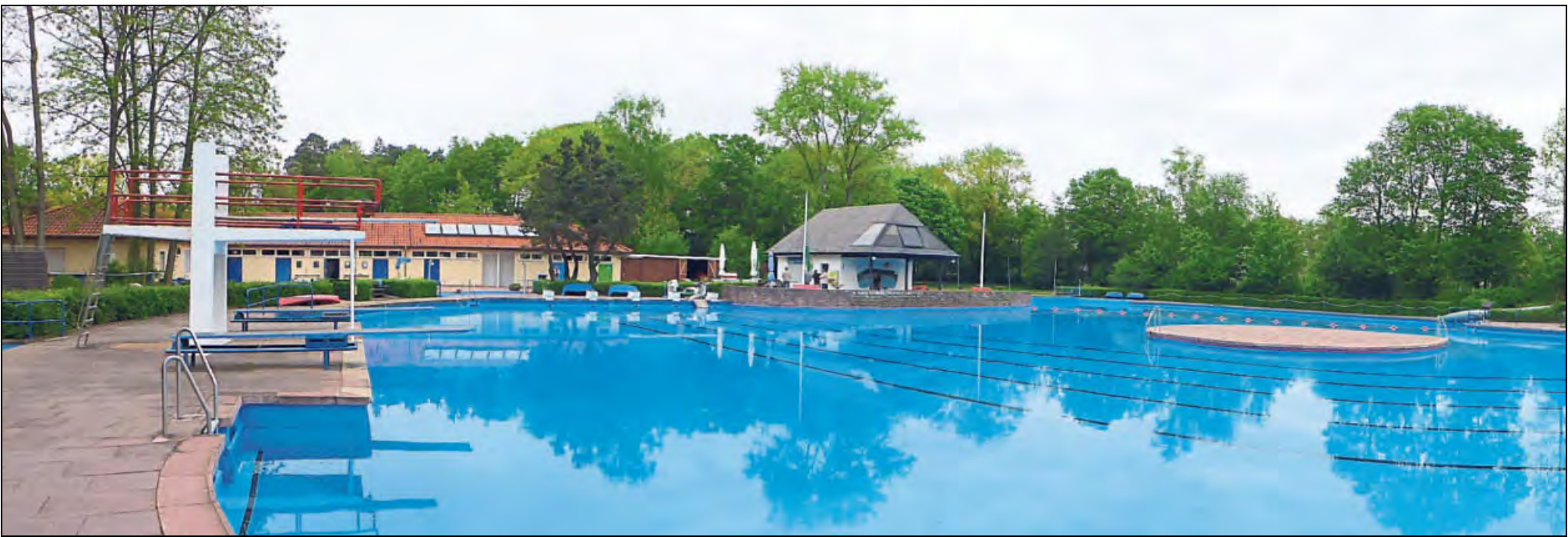
Eine »blaue Lagune« mit der Badeinsel. »Ist das nicht ein schöner Anblick...«, freuen sich die Ehrenamtlichen auf die neue Saison im Waldfreibad.