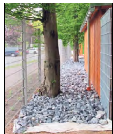
Gabionensteine sorgen für Sauberkeit am Zaun.

tagen von 9 bis 19 Uhr. Die Eintrittspreise sind stabil geblieben: Erwachsene zahlen 3,20 Euro und Kinder 2 Euro. Dauerkarten und Ermäßigungen sind an der Kasse erhältlich.