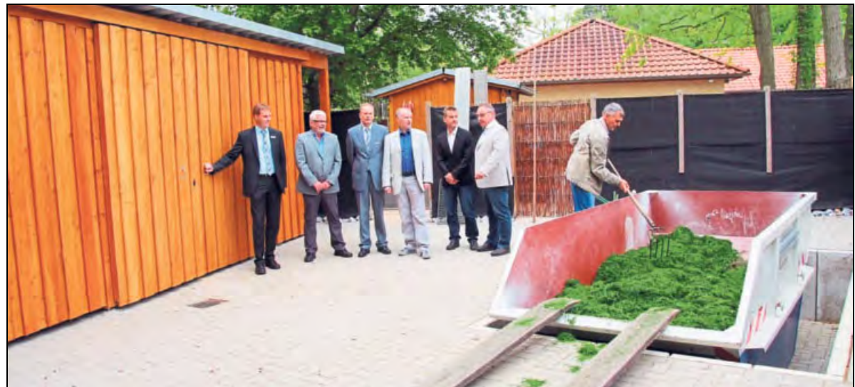
Sponsoren und Vorstandsmitglieder schauen sich jetzt abgesenkte Grünschnittmulde macht die Arbeit für die Ehrenamtlichen einfacher. den neuen »Bauhof« mit dem Gerätehaus an. Die

Gearbeitet haben die Mitglieder bereits seit Herbst 2016. Der »Bauhof«, des Bades, eine Ecke, in der die Gerätschaften für die Pflege